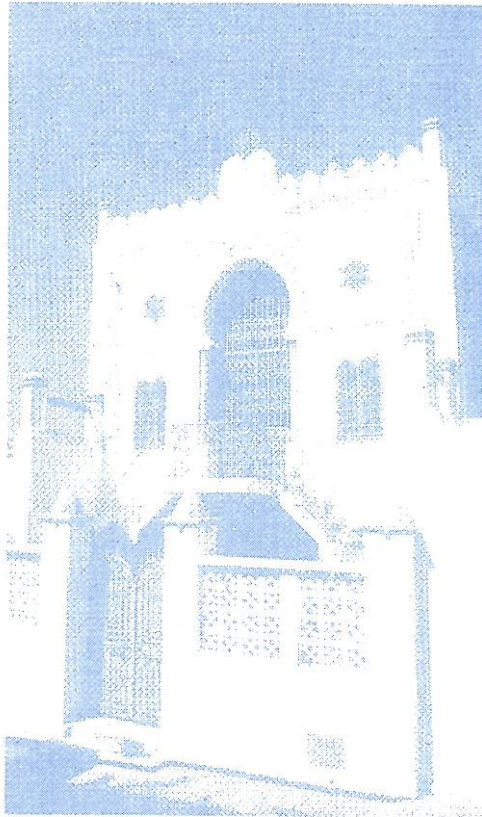
Synagogue Keren Ichoua La Marsa

Inscriptions et informations Société d'Histoire des Juifs de Tunisie 45, rue La Bruyère – 75009 PARIS Tél. : 01 48 78 24 96 Permanence téléphonique : de 14h à 18h